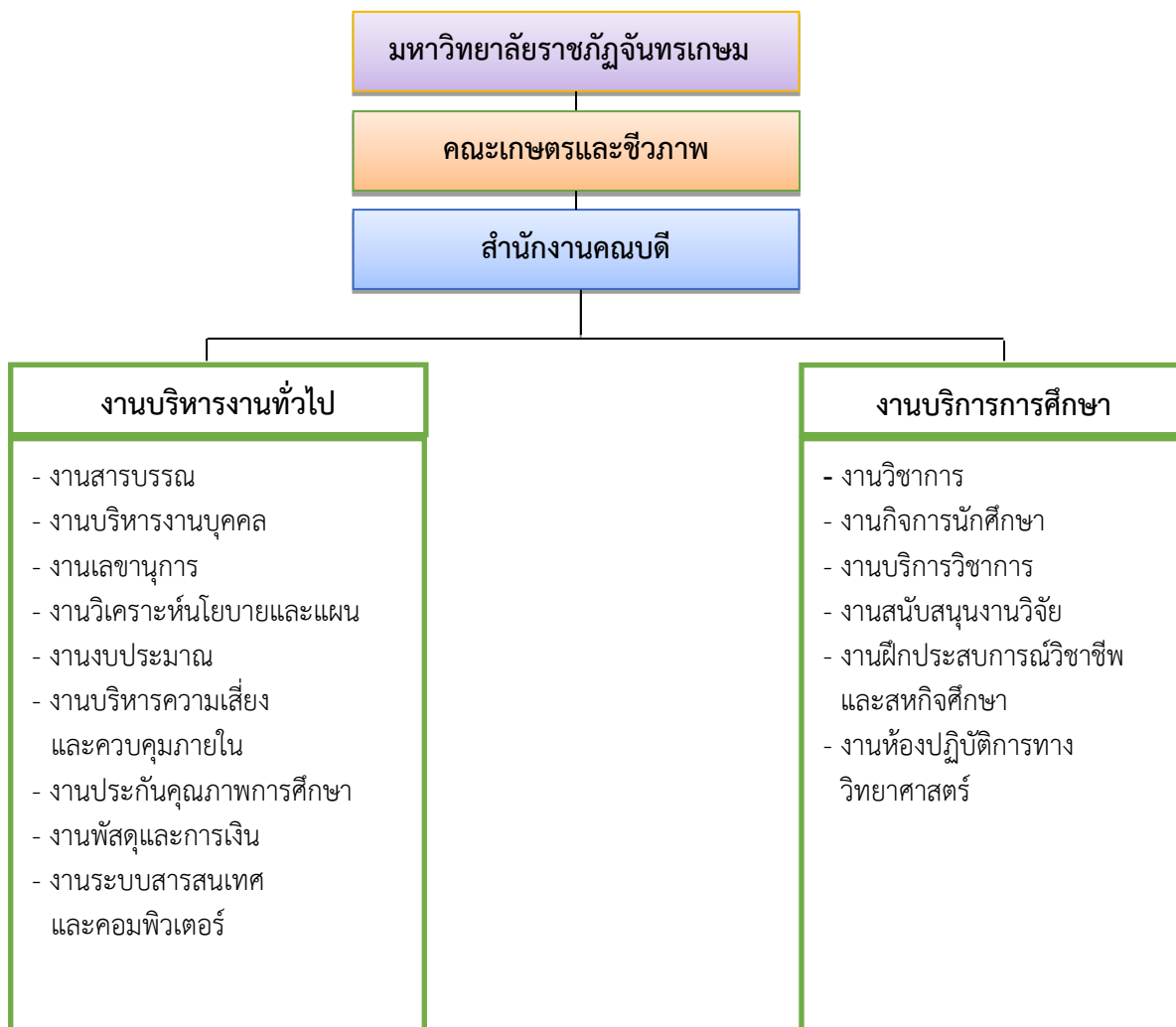
ภาพที่ 3 โครงสร้างองค์กรคณะเกษตรและชีวภาพ